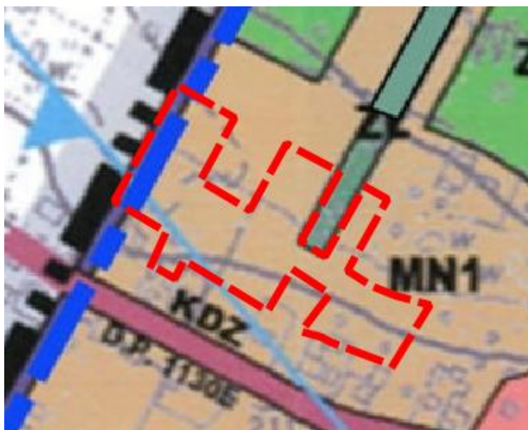
Rysunek 3 Wyrys ze studium uwarunkowań i kierunków zagospodarowania gminy Andrespol dla obszaru opracowania