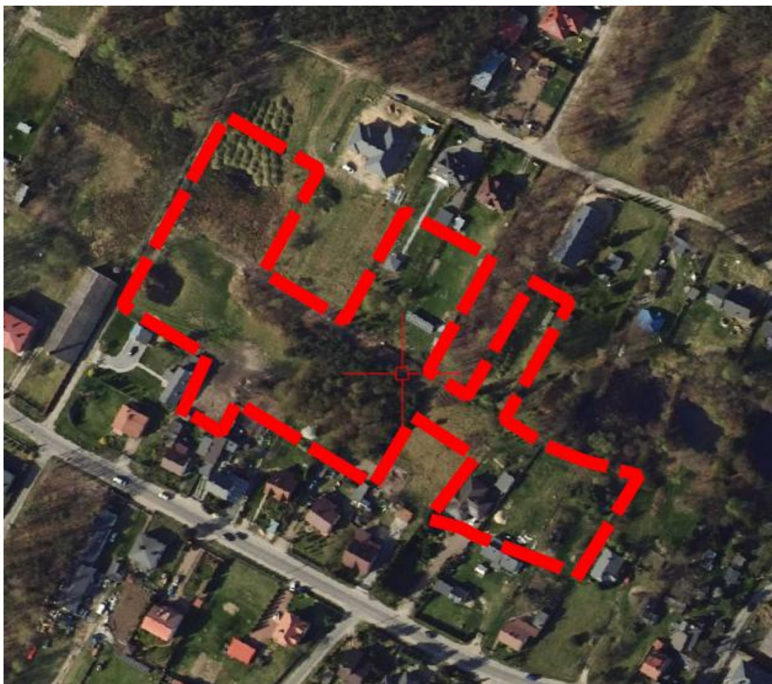
Rysunek 2 Obszar objęty ustaleniami planu miejscowego na tle ortofotomapy.

Krajobraz obszaru opracowania charakteryzuje się dużym udziałem terenów pokrytych zielenią niską i wysoką. Występuje tu zabudowa mieszkaniowa i gospodarcza. W sąsiedztwie obszaru znajdują się tereny zabudowy mieszkaniowej i usługowej.