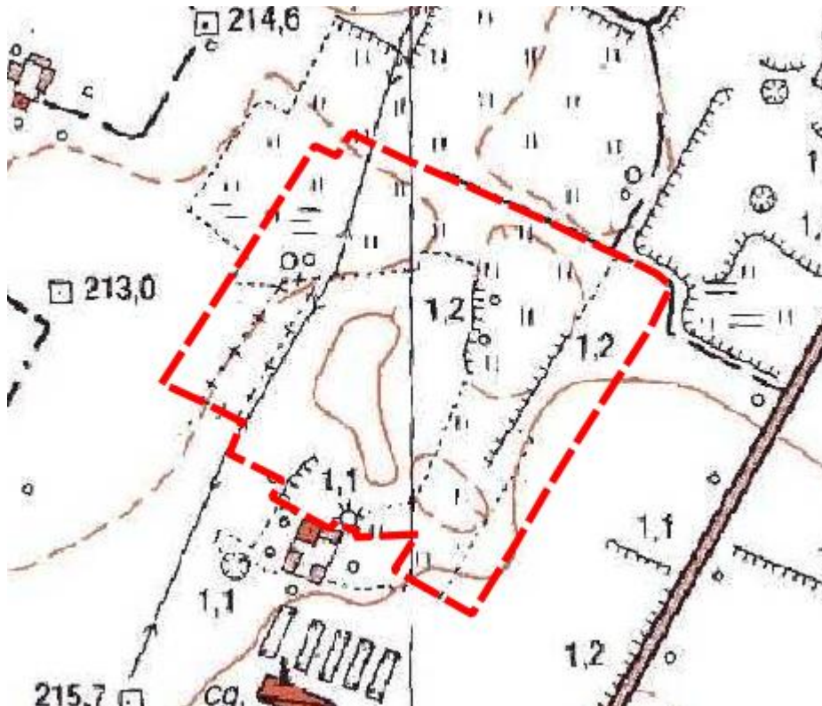
Rysunek 1 Położenie obszaru opracowania na mapie topograficznej przedstawiającej fragment gminy Andrespol

Gmina wiejska Andrespol znajduje się w centralnej części województwa łódzkiego, w powiecie łódzkim-wschodnim. Zajmuje powierzchnię ok. 25,74 km 2 i jest zamieszkiwana przez 14 838 osób (dane za 2024 rok).