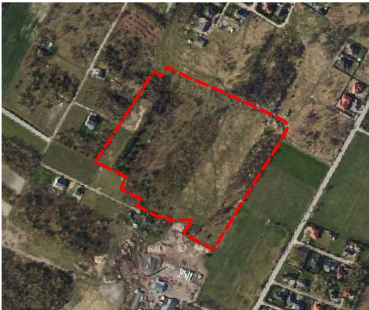
Rysunek 2 Obszar objęty ustaleniami planu miejscowego na tle ortofotomapy.

Krajobraz obszaru opracowania charakteryzuje się dużym udziałem terenów pokrytych zielenią niską i wysoką. Nie występuje tu żadna zabudowa. W sąsiedztwie obszaru znajdują się tereny zabudowy mieszkaniowej i usługowej.