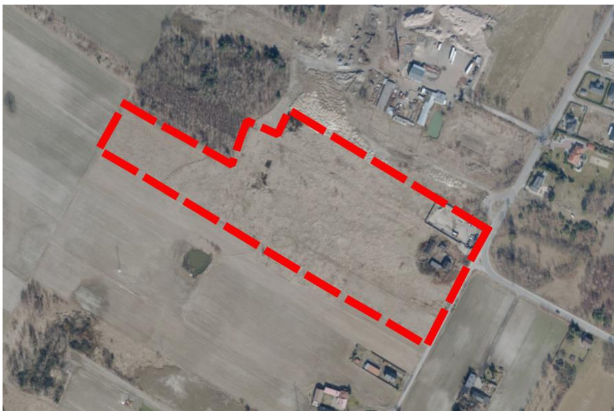
Rysunek 2 Obszar objęty ustaleniami planu miejscowego na tle ortofotomapy.

Krajobraz obszaru opracowania charakteryzuje się dużym udziałem terenów rolnych. Występuje tu również zabudowa mieszkaniowa położona przy drodze lokalnej we wschodniej części obszaru. Na północny zachód od obszaru opracowania znajduje się niewielki teren zadrzewiony, natomiast w sąsiedztwie dominują tereny rolne i zabudowane głównie budynkami mieszkalnymi jednorodzinnymi.